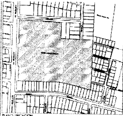
PLANTA UBICACION SIN ESCALA